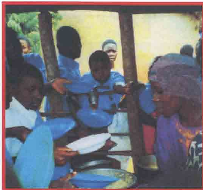
Uganda; l'hora de dinar a la Hillside School.

Finalment, l'estudi que es va fer a Djibuti sobre el greu problema de la TB resistent als medicaments, amb la col·laboració del Laboratori de Micobacteris de l'Hospital Vall d'Hebron, va originar una visita d'experts internacionals que ha fet unes recomanacions per corregir les deficiències detectades.